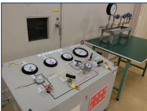
ガスブースター装置（110MPa）