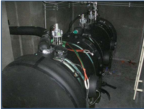
耐爆・温調チャンバー