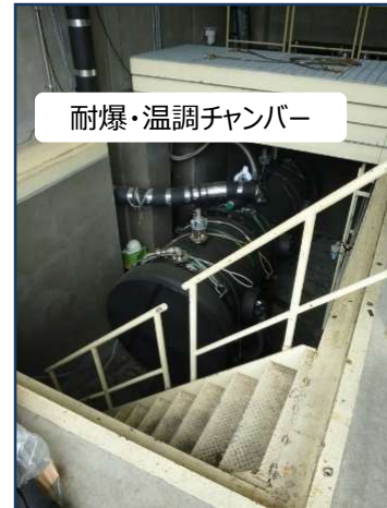
地下ピット（試験時）