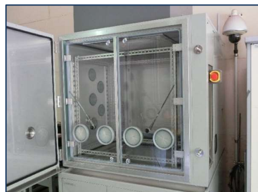
超低温恒温恒湿槽（-70～150℃）